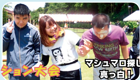
マシュマロ探して 真っ白！！