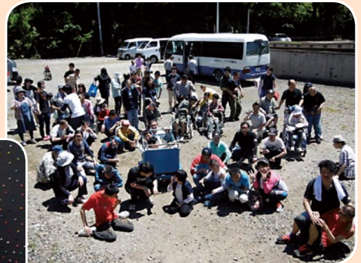
みんな楽しく、 春の外出！！