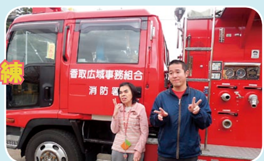
本物の消防車が来てくれました。