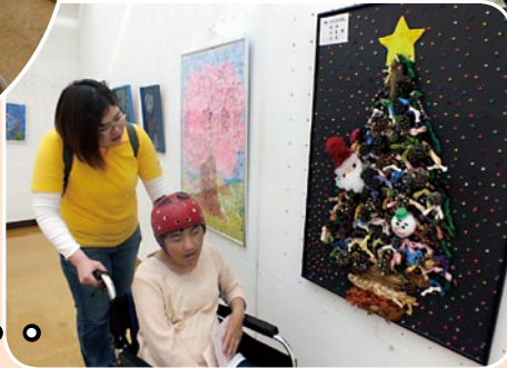
素敵な作品と 一緒に。。。