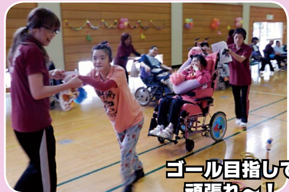
ゴール目指して 頑張れ～！