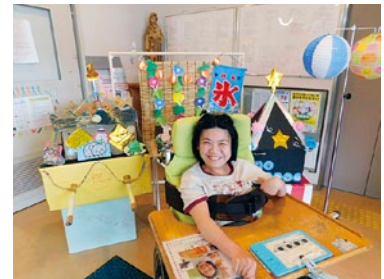
夏祭りの お神輿と