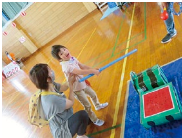
お楽しみ会で スイカ割り をしました