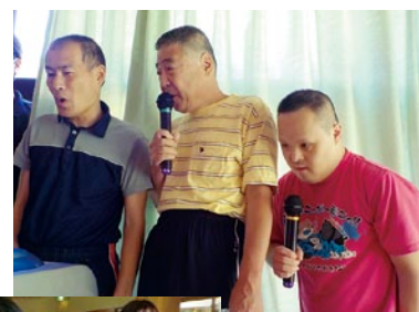
カラオケ のど自慢