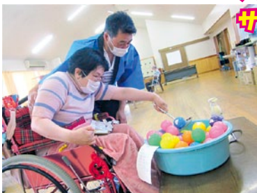
ボールに何か書いてあるぞ。。。