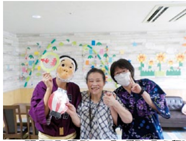
縁日の格好と飾りで大盛り上がり!!