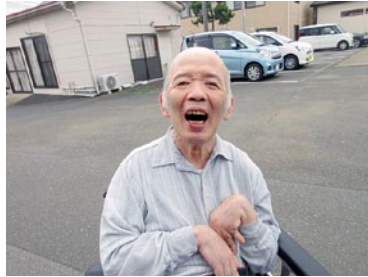
ロザリオ敷地内をお散歩♪