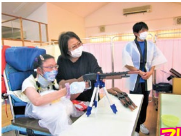
狙いを定めて 景品ゲット!