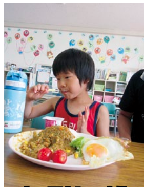
キーマカレーより ヨーグルト♪