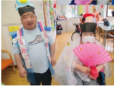
七夕まつりを仮装して楽しんだよ