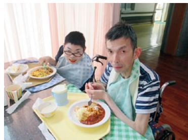
仲良く☆いただきます!!