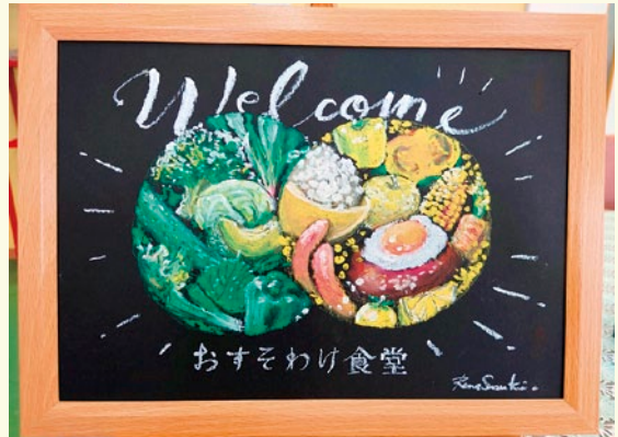
作画：すずきらな さん