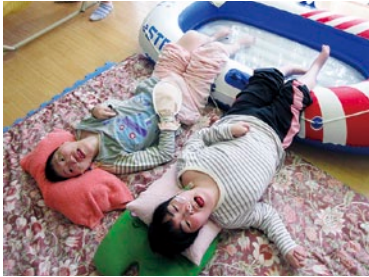
足浴を行いリラックス^_^