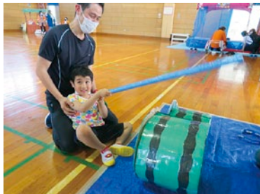
親御さんと 一緒に楽しく 行えました